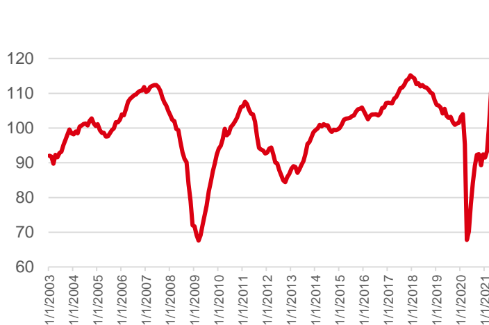
Grifik 2: Optimis pada ekuitas Eropa karena momentum pertumbuhan Indikator sentiment ekonomi Zona Euro